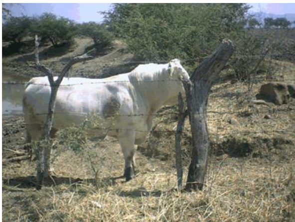
Cerro del Tuy en San Pedro Ocotlán